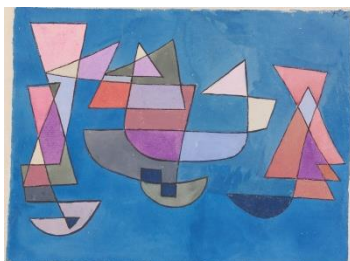
Ein Bild von Paul Klee