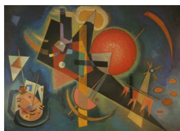
Ein Bild von Wassily Kandinsky