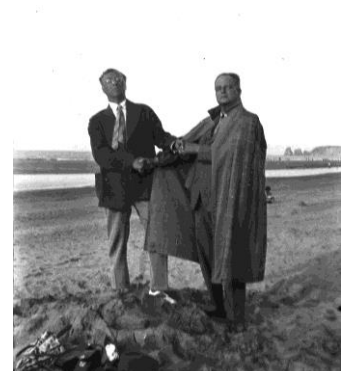
Wassily Kandinsky und Paul Klee (mit Mantel)